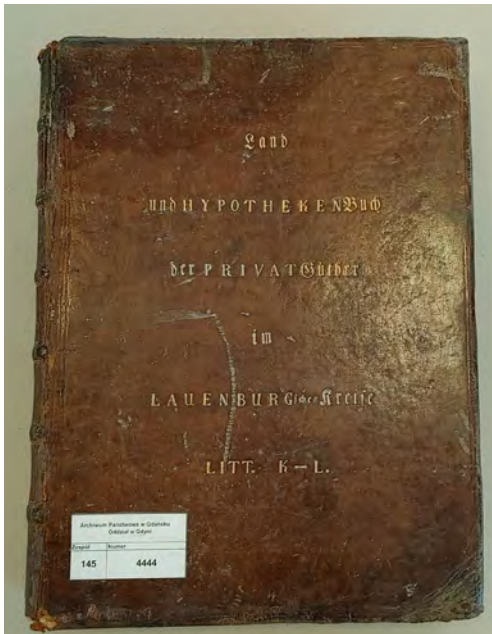
„Land und Hypotheken Buch” z Sądu Obwodowego w Łęborcu, sygn. 145/4444.

Poszczególne pisma i dokumenty były zbierane na przestrzeni lat i zszywane w akta spraw o grubości ok. 200 kart, a po przekroczeniu tej liczby zakładano dla danej sprawy kolejny tom akt, jakkolwiek z czasem nie było to obowiązującą praktyką, bowiem zachowały się posyty prawie dwa razy grubsze. Zakres chronologiczny wychodzący poza formalne daty działania sądu (1879–1945), zamykający się w przedziale lat od 1648 do 1964 r. wynika właśnie z faktu łączenia w teczkach dokumentów dotyczących poszczególnych posesji - najwcześniejszy pochodzi właśnie z 1648 r. i dotyczy nieruchomości w Łęczycach (Lanz), a najpóźniejsze akta z 1964 r. dotyczą przejmowania przez Skarb Państwa majątków poniemieckich. W każdym razie ten zespół akt liczący w sumie 4547 j.a. jest cennym zbiorem dokumentów często wykorzystywanych w badaniach historii regionalnej czy poszukiwaniach genealogicznych bądź własnościowych 17 .