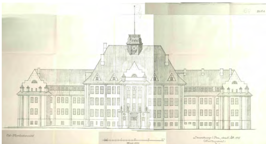
Rysunek elewacji liceum państwowego przy Goethestrasse 20 w Łęborku (obecnie I L.O. przy ul. Dygasińskiego), sygn. 224/234.