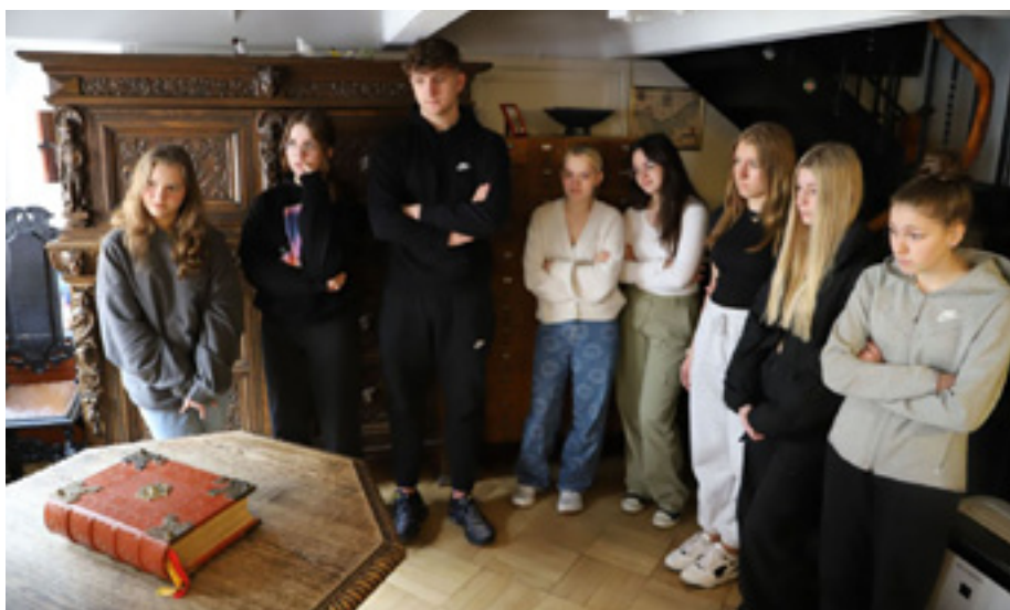
Lekcja archiwalna dla uczniów Liceum im. Sybiraków w Szczecińskiej Szkole Florystycznej – biblioteka archiwalna