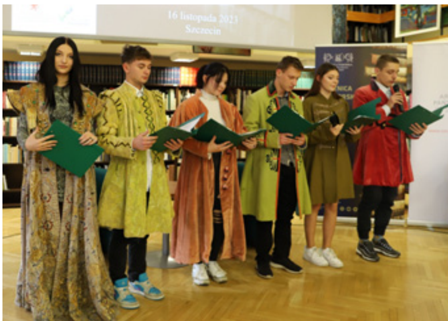
Wyprawa do źródła, Młodzieżowy Ośrodek Socjoterapii nr 2 w Szczecinie MOS Nr 2 Szczecin.