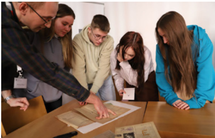
Lekcja archiwalna dla uczniów Zespołu Szkół nr 1 w Stargardzie.