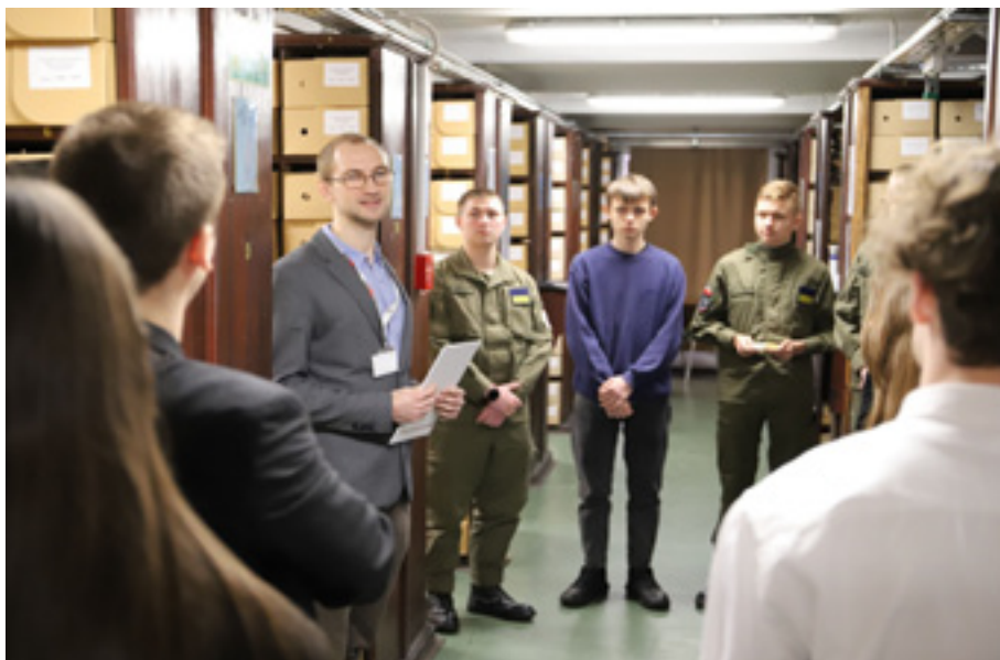
Uczestnicy konkursu podczas zwiedzania magazynu archiwalnego.