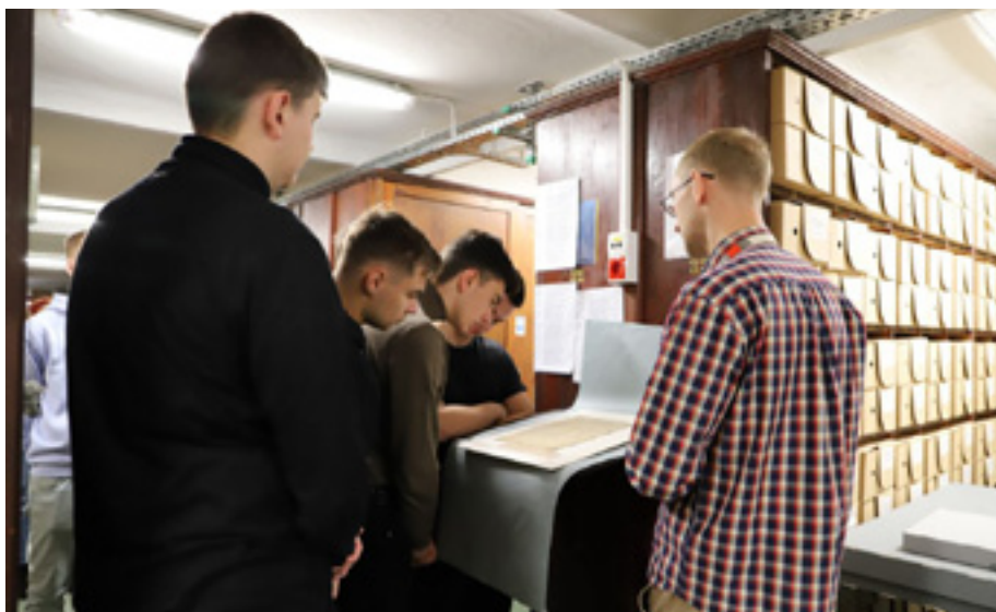
Lekcja archiwalna dla uczniów Zespołu Szkół nr 1 im. Mieszka I w Stargardzie - magazyn archiwalny.