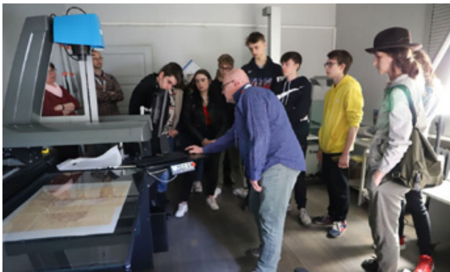
Prelekcja o poszukiwaniach genealogicznych dla uczniów Technikum Kreatywnego w Szczecinie – w pracowni digitalizacji