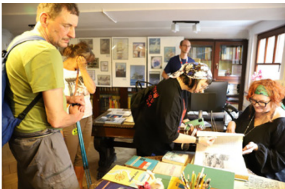
Międzynarodowy Dzień Archiwów – 17 czerwca 2023 r. Wystawa wydawnictw książkowych dot. gospodarki morskiej Szczecina.