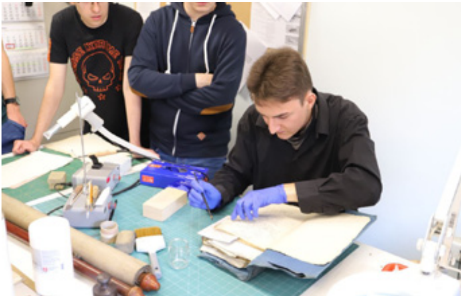
Lekcja archiwalna dla studentów Instytutu Historycznego Uniwersytetu Szczecińskiego – pracownia konserwacji.