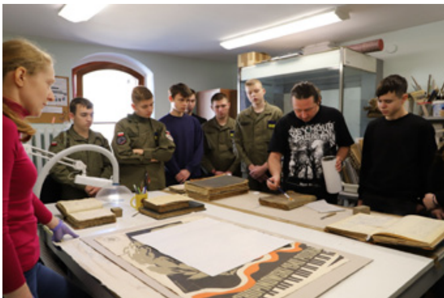
Uczestnicy konkursu podczas zwiedzania pracowni konserwacji.