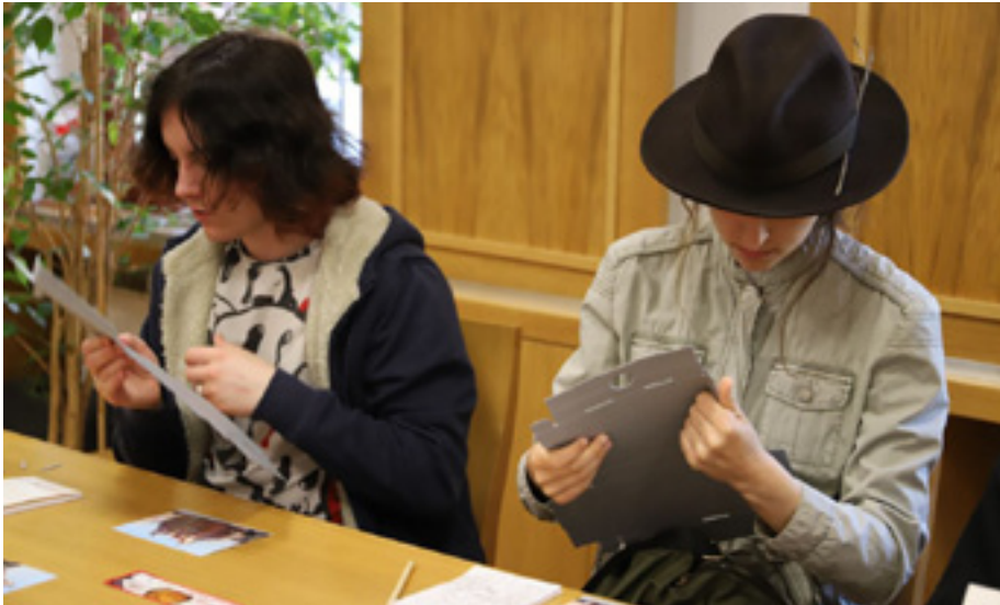
Prelekcja o poszukiwaniach genealogicznych dla uczniów Technikum Kreatywnego w Szczecinie – prezentacja materiałów do zabezpieczenia archiwaliów