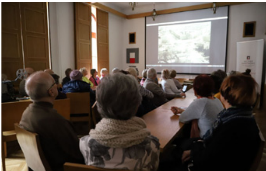
Lekcja archiwalna dla członków Stowarzyszenia Koło Emerytów i Rencistów przy Telekomunikacji Polskiej w Szczecinie.