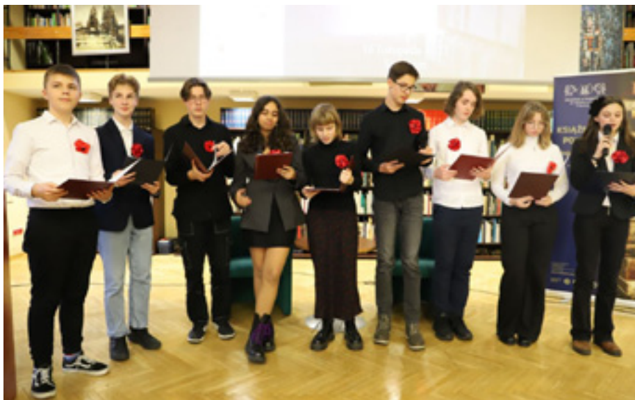
Wyprawa do źródła, IX Liceum Ogólnokształcące im. Bohaterów Monte Cassino w Szczecinie.