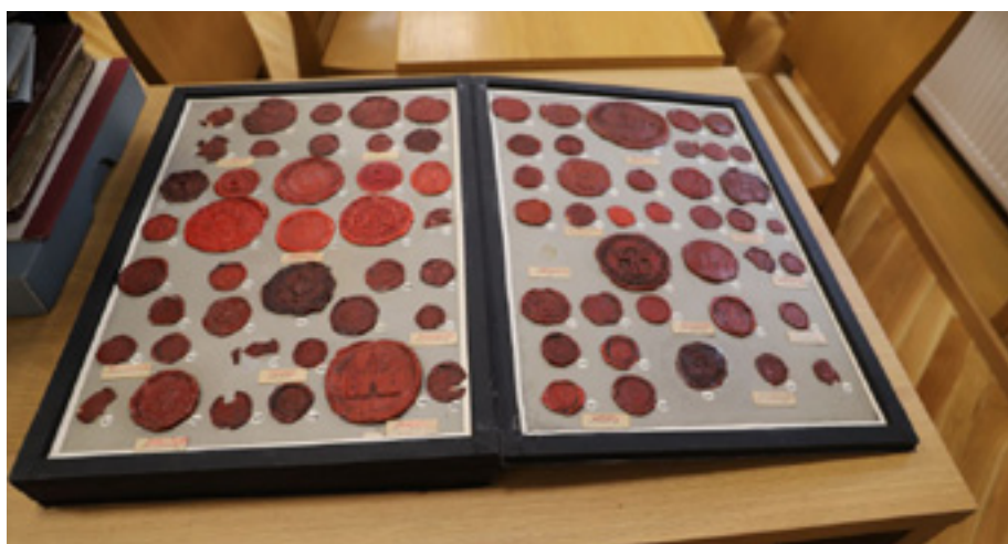
Lekcja archiwalna dla uczniów Zespołu Szkół nr 1 w Goleniowie.