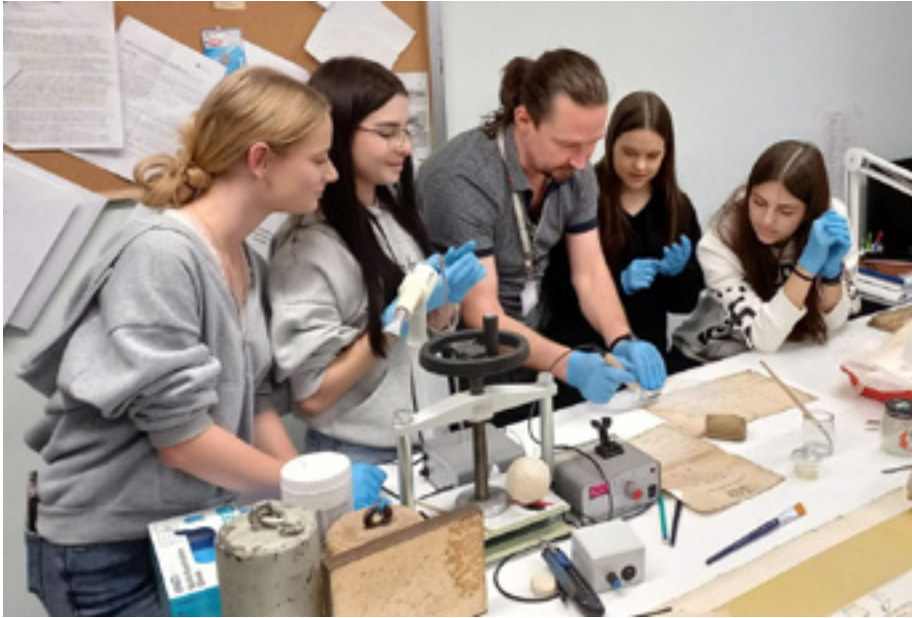
Lekcja archiwalna dla uczniów Szkoły Podstawowej nr 68 w Szczecinie – pracownia konserwacji