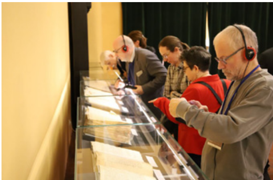
Konferencja naukowa Bogusław X. Życie i działalność renesansowego księcia na Pomorzu i w Europie – prezentacja archiwaliów z zasobu Archiwum Państwowego w Szczecinie.