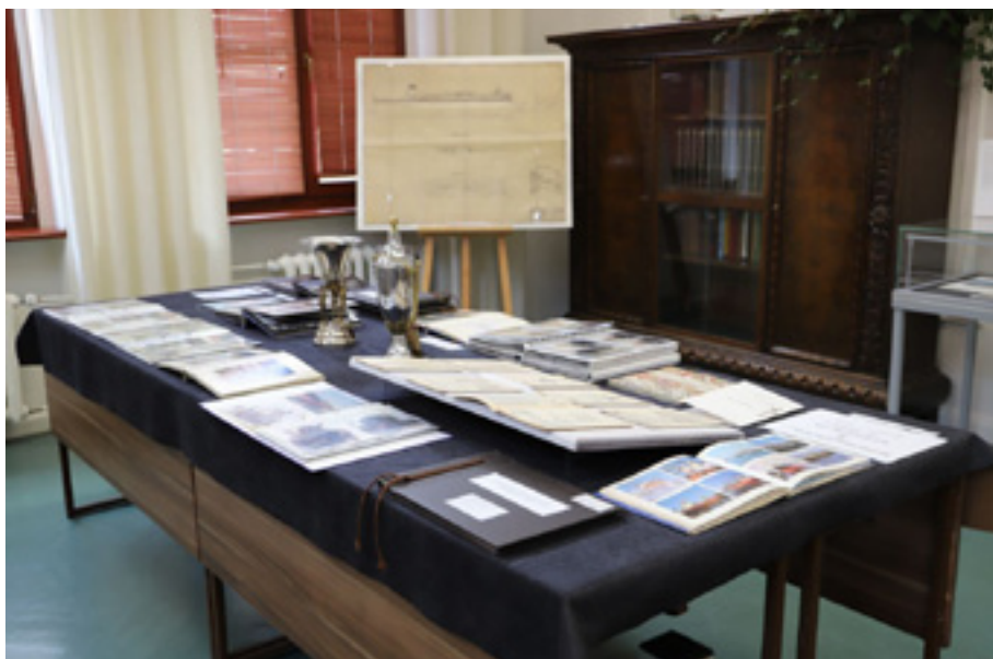
Międzynarodowy Dzień Archiwów – 17 czerwca 2023 r. Fragment wystawy archiwaliów nt. gospodarki morskiej Szczecina.