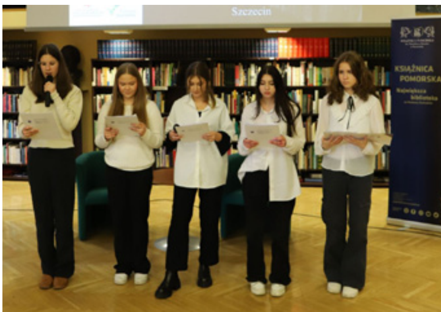
Wyprawa do źródła, Liceum Ogólnokształcące im. Sybiraków w Szczecińskiej Szkole Florystycznej.