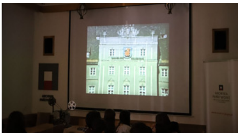
Archiwalna lekcja filmowa dla uczniów IX Liceum Ogólnokształcącego im. Monte Cassino w Szczecinie. Fragment filmu Nasz Szczecin .