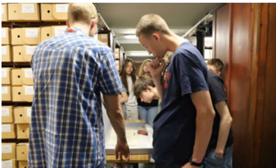
Lekcja archiwalna dla uczniów XII Liceum Ogólnokształcącego w Szczecinie – pokaz archiwaliów w magazynie