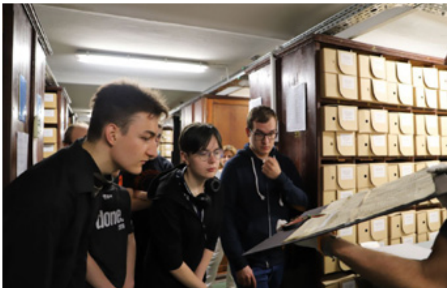
Lekcja archiwalna dla studentów Instytutu Historycznego Uniwersytetu Szczecińskiego – magazyn archiwalny.

ność archiwalną. Podczas wizyty zaprezentowane zostały m.in. wydawnictwa z dziedziny archiwistyki (w tym informatory o zasobie i katalogi różnych archiwów), numery gazety „Pionier Szczeciński” z 1945 r., książka „Polska a Bałtyk”, która przemierzała morza i oceany na pokładzie ORP Garland, oraz publikacje dotyczące Czech. Była to również okazja, by zobaczyć wystawę „Gospodarka morska Szczecińska”, przygotowaną z okazji Międzynarodowego Dnia Archiwów 2023. Studenci zwiedzili także czytelnię, magazyn archiwalny – tutaj zaprezentowaliśmy m.in. dokument księcia pomorskiego Bogusława IV rozstrzygający spór między klasztorem w Kołbaczu a miastem Gryfino z 1279 r., przywilej króla polskiego Jana Kazimierza dla miasta Jastrowie z 1649 r., księgę miasta Łeby prowadzoną od XV do XVII wieku oraz dokumenty z przejścia Szczecina przez polską administrację w 1945 r., pracownię digitalizacji, pracownię konserwacji – tu z kolei młodzi adepci historii poznali metody oczyszczania, prostowania i podklejania papieru i pergaminu, zobaczyli jak wyglądają filigrany oraz dowiedzieli się na czym polegał XVI-wieczny recykling.