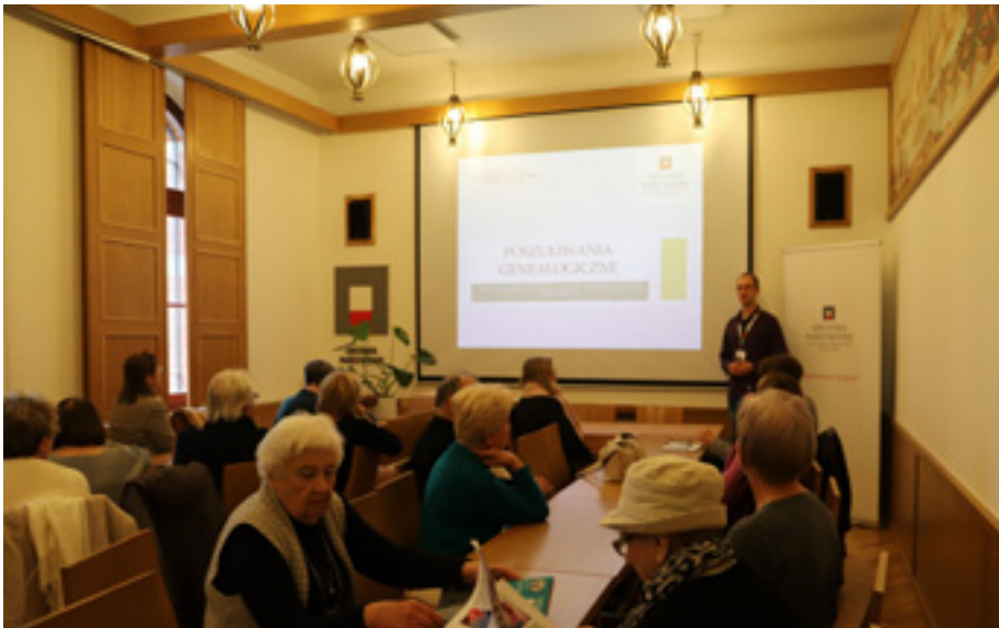
Lekcja archiwalna dla studentów Uniwersytet Trzeciego Wieku w Szczecinie