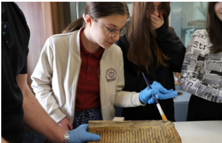
Lekcja archiwalna dla uczniów Zespołu Szkół nr 1 w Stargardzie – pracownia konserwacji.