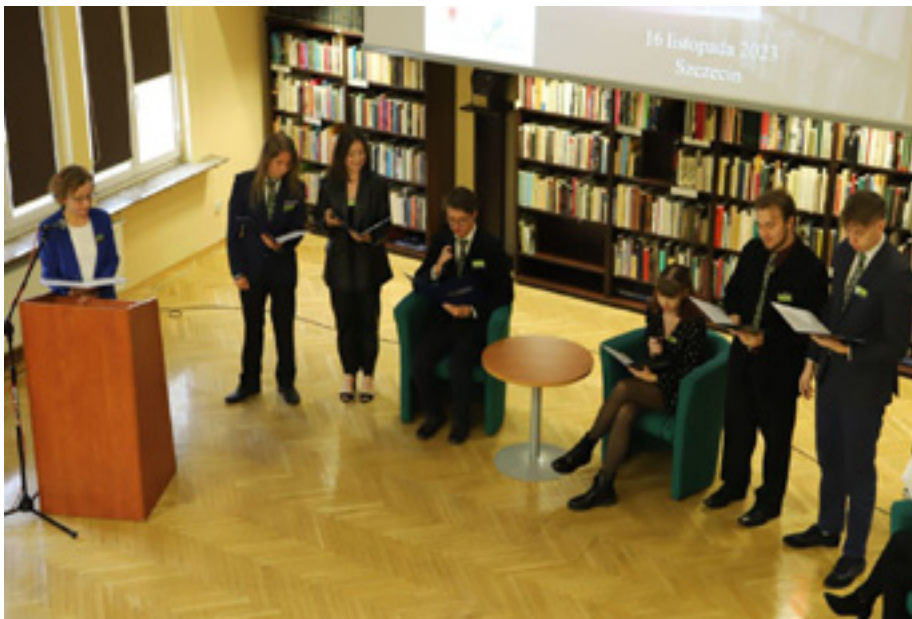
Wyprawa do źródła, Technikum Technologii Cyfrowych.