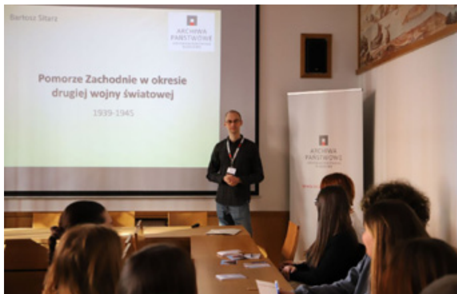
Lekcja archiwalna dla uczniów Zespołu Szkół nr 1 w Stargardzie.