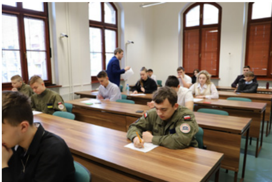
Rozpoczęcie konkursu w czytelni Archiwum Państwowego w Szczecinie.