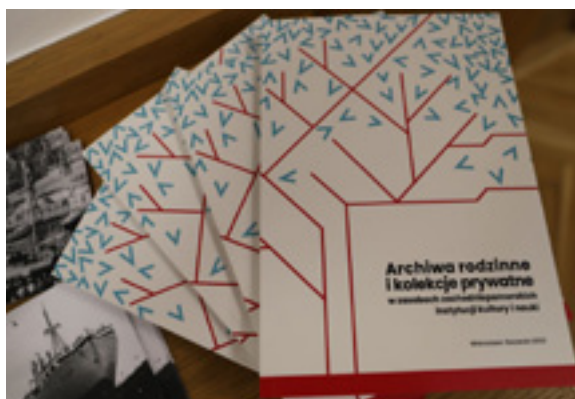
Publikacja „Archiwa rodzinne i kolekcje prywatne w zasobach zachodniopomorskich instytucji kultury i nauki”, red. Janina Kosman.