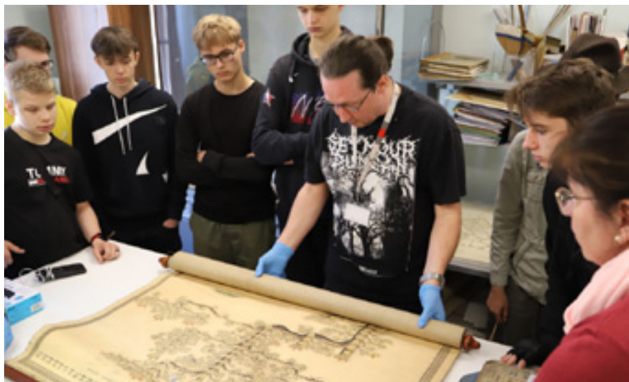
Prelekcja o poszukiwaniach genealogicznych dla uczniów Technikum Kreatywnego w Szczecinie – pracownia konserwacji