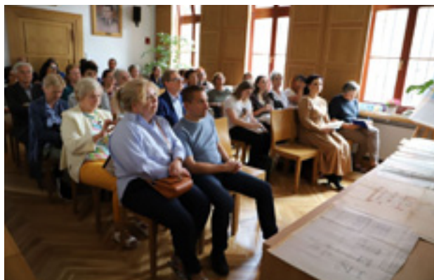
Zachodniopomorskie Dni Dziedzictwa – wykład Wille Łękna w przestrzeni architektonicznej Szczecina.