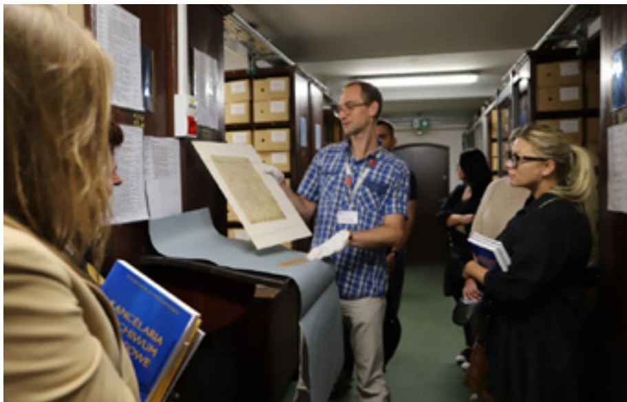
Dzień Archiwisty , pokaz wybranych archiwaliów w magazynie.