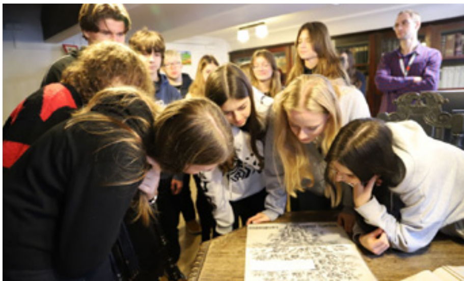
Lekcja archiwalna dla uczniów Szkoły Podstawowej nr 68 w Szczecinie – biblioteka archiwalna

Uczestnicy spotkań mogli także zwiedzić Archiwum Państwowe w Szczecinie, zobaczyć bibliotekę, magazyn archiwalny i pracownię konserwacji archiwaliów, gdzie chętne osoby mogły spróbować swych sił przy prostych pracach zabezpieczających. Zaprezentowaliśmy także najciekawsze dokumenty z naszego zasobu.