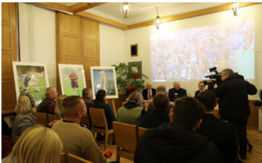
Dzień Darczyńcy, w tle na sztalugach i wyświetlane na ścianie fotografie Marka Biczyka.