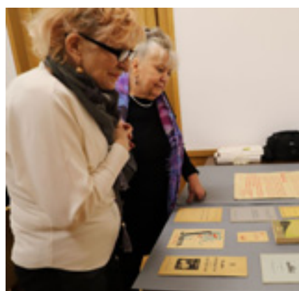
Lekcja archiwalna dla członków Stowarzyszenia Koło Emerytów i Rencistów przy Telekomunikacji Polskiej w Szczecinie.