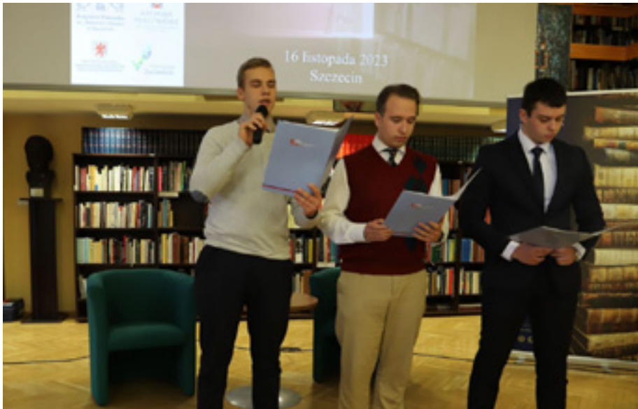
Wyprawa do źródła, Zespół Szkół Budowlanych im. Kazimierza Wielkiego.